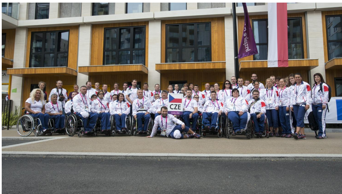
Český paralympijský tým - Paralympijská vesnice, Londýn, VB

Bezespornu nejvýznamnější akcí roku 2012 se staly 14. Letní paralympijské hry, které se konaly v hlavním městě Velké Británie, v Londýně. Her se zúčastnilo celkem 4. 237 sportovců ze 164 zemí světa, kteří zápolili ve 20 sportovních odvětvích. Dle slov předsedy Mezinárodního paralympijského výboru, Sira Philipa Cravena a mnohých dalších účastníků her, se Londýn nyní může pyšnit označením za pořádání nejlepších paralympijských her v historii. Většina sportovišť byla již několik měsíců dopředu vyprodána a tak sportovce čekaly plné stadiony nadšených a fandících diváků. Celkový počet diváků, kteří se přišli podívat na stadióny a sportoviště, se přehoupl přes 2,7 milionu diváků. Samotný zahajovací ceremoniál sledovalo podle odhadů jen ve Velké Británii více než 11 milionů diváků. Na úspěšném pořádání akce se podílelo přes 70 tisíc dobrovolníků. Nejúspěšnější výpravou se stala reprezentace Číny, která si z dějiště her odvezla celkem 231 medailí, z toho 95 zlatých! Na druhém místě se umístila reprezentace Ruska s 36 zlatými a pomyslné třetí místo připadlo reprezentaci domácí Velké Británie, která vybojovala 34 zlatých medailí.