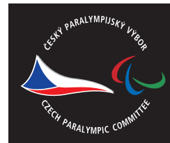
plnobarevné provedení rozšířená verze