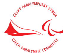
jednobarevné provedení červené - rozšířená verze