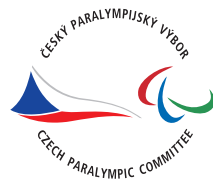
plnobarevné provedení základní verze