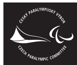
jednobarevné inverzní provedení