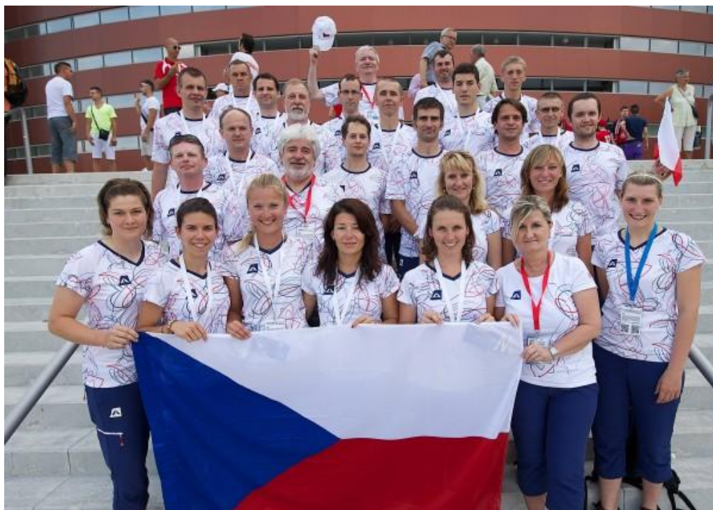
ČESKÝ DEAFLYMPIJSKÝ TÝM - FOTO MARTIN MALÝ